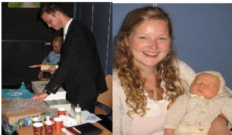
Foto's van de startzondag